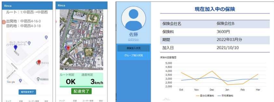
スマホアプリ画面（左から配達開始前、配達中）と Web アプリ画面

実験では、「推奨ルート以外を走行していないか」「スピードを超過していないか」についてスマホアプリで走行中の位置等の情報を収集し、配達結果を正しく評価できるか、そして、ブロックチェーン上で共有された配達スコアから保険料を計算する検証を実施しました。保険料の計算では、グループ保険の形式を想定してグループ単位でグループ内の各配達員の保険料を自動的に計算するブロックチェーンのスマートコントラクト（予め設定された条件に沿って契約を自動的に執行する仕組み）を開発しました。