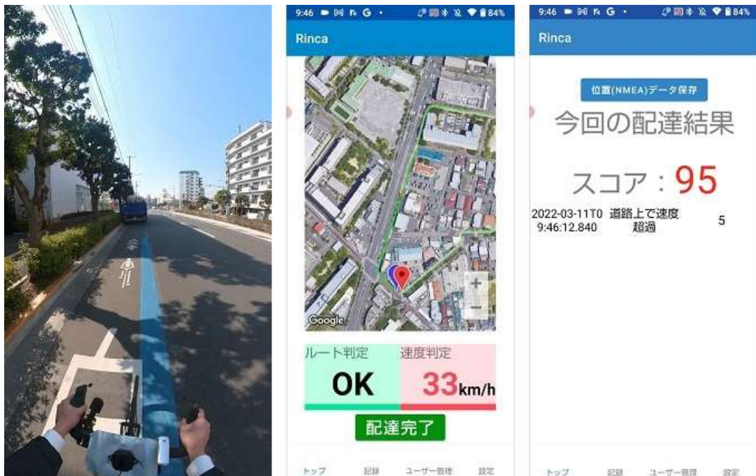
実証実験の様子（左から走行時の位置情報取得、リアルタイム判定、配達評価結果）

実験では、「推奨ルート以外を走行していないか」「スピードを超過していないか」についてスマホアプリで走行中の位置等の情報を収集し、配達結果を正しく評価できるか、そして、ブロックチェーン上で共有された配達スコアから保険料を計算する検証を実施しました。保険料の計算では、グループ保険の形式を想定してグループ単位でグループ内の各配達員の保険料を自動的に計算するブロックチェーンのスマートコントラクト（予め設定された条件に沿って契約を自動的に執行する仕組み）を開発しました。