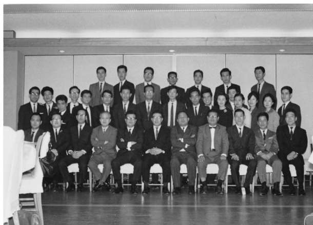
写真1 会社設立時の社員集合写真

CAC設立は、日本のソフトウェア産業にとって記念すべき日となった。コンピュータの導入計画からシステム設計、プログラミング、そして稼働までの一貫した受注が可能な独立系ソフトウェア専門会社が日本に初めて誕生したからである。しかし当時、この旗上げは無謀だという声が圧倒的に多かった。これは当然のことだった。日本のはるか先を行くアメリカでは独立系、エンドユーザー志向のソフトウェア会社が活躍を始めていたが、市場の主役と言える存在ではなかった。まして日本では、メーカー丸抱えのソフトウェア会社が数社あったに過ぎなかったからである。当時、ソフトウェアはまだハードウェアの付属物と考えられていた。