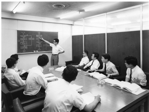
写真2 創業初期の開発風景

制御システムの受託開発の歴史は、営業開始とほぼ同時に始まっている。66年10月、焼結工程システムのアプリケーションプログラム開発を受注したのを皮切りに、同年中に大阪浄水場データロガーの一部、67年に入って製鉄所の転炉制御システム、火力発電所データロガーと続く。そして67年末には、石化工場のエチレン、BTX（ベンゼン、トルエン、キシレン）、ボイラーの3システム同時受注に成功している。これはソフトウェア開発の全工程を請負った大型プロセス制御システムとして初めてのものだった。この時期は、プラントで計算機