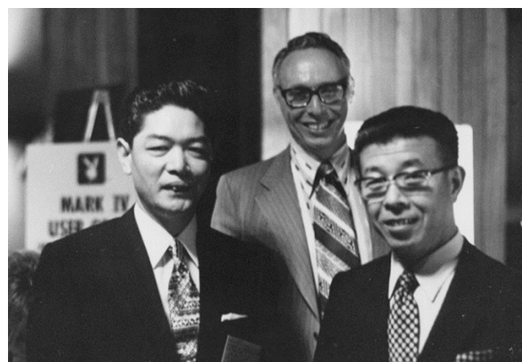
写真4 1972年MARK IVユーザー会に参加(シカゴ)

今日ではシステム開発・運用の受託サービスのイメージが強いCACだが、ソフトウェアパッケージへの取組みも早かった。71年6月、米国Informatics Inc.の社長の訪問を受けて代理店契約を依頼されると、社員4人を2ヵ月ほど欧米の視察に送り出し、その旅程の最後にInformaticsと契約を締結して同年10月に「MARK IV」(アプリケーション開発システム)の日本国内販売を開始した。契約に踏み切った理由は、海外で実績がある、将来のために勉強したい、常に新しいものに目を向けたい、というものだった。特に、将来の自主開発に備えた足がかりにする意図が大きかったという。MARK IVのユーザー数は78年末には40社に達し、さらに80年代にはInformatics社以外の取扱い製品を増やしたが、業績は次第に伸び悩み、パッケージ事業は主力を開発ツールなどシステムソフトから業務アプリケーションに移していった。